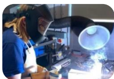
Weldio a Pheirianneg

ddarpariaeth sgiliau i gyflogwyr yn y sir. Yn ogystal â gweithio'n agos gydag ysgolion wrth ddarparu cyrsiau galwedigaethol a chwricwlwm amgen, mae HCT yn cyflwyno rhaglenni Hyfforddeiaethau, Prentisiaethau a Dysgu Seiliedig ar Waith ar ran Llywodraeth Cymru, ar hyn o bryd trwy gytundebau wedi eu his-gontractio gydag ACT Ltd. Mae HCT hefyd yn darparu hyfforddiant ar sail fasnachol i'r gymuned ehangach ar draws meysydd galwedigaethol amrywiol. Mae HCT wedi bod yn chwarae rhan weithredol wrth ddarparu dysgu seiliedig ar waith yng Ngheredigion ers dros 30 mlynedd. Mae HCT yn cynnig ystod o gyrsiau galwedigaethol sy'n paratoi pobl ar gyfer y gweithle trwy ddarparu hyfforddiant sgiliau yn y pynciau canlynol: