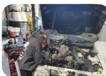
Cynnal a Chadw Cerbydau